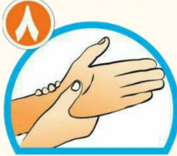
دور مچ هر دو دست را بشویید.