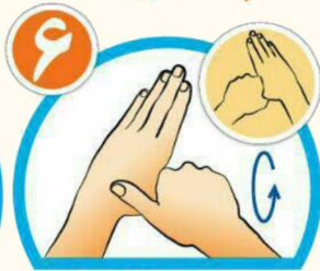
شست ها را جداگانه و دقیق بشویید.