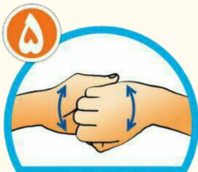
نوک انگشتان را در هم گره کرده و به خوبی بشویید.