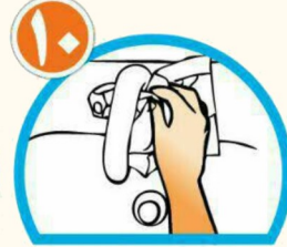
با همان دستمال شیر آب را ببندید و دستمال را در سطل زباله بیاندازید.