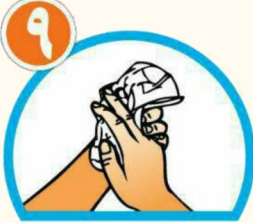
دست ها را با دستمال خشک کنید.