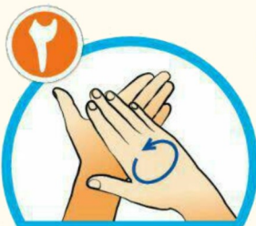
کف دست ها را با هم بشویید.