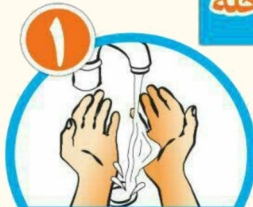
دست ها را خیس کرده و بعد آن ها را صابونی کنید.