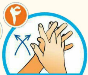
بین انگشتان را از روبرو بشویید.